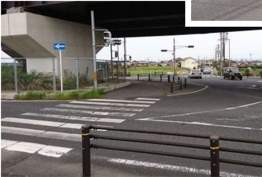
← 撮影場所 D