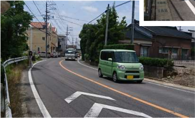
← 撮影場所 B