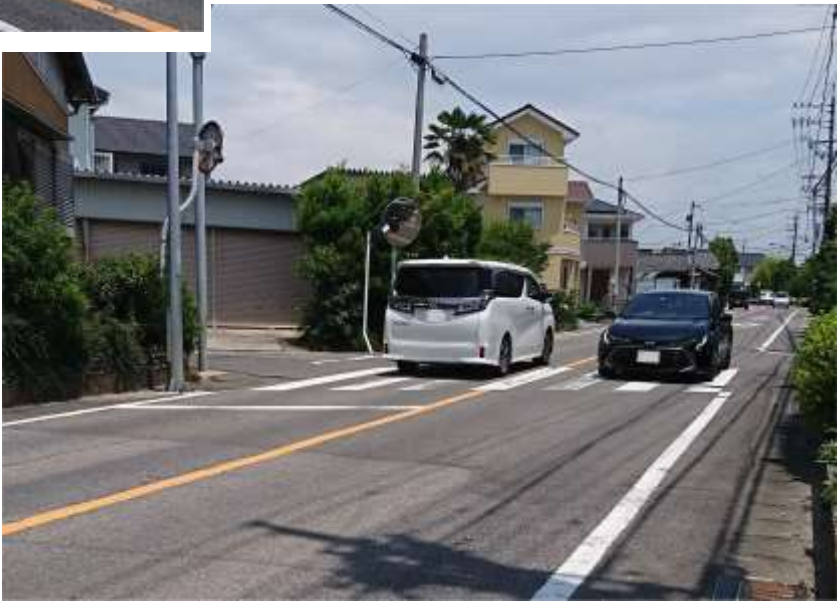
撮影場所 C →