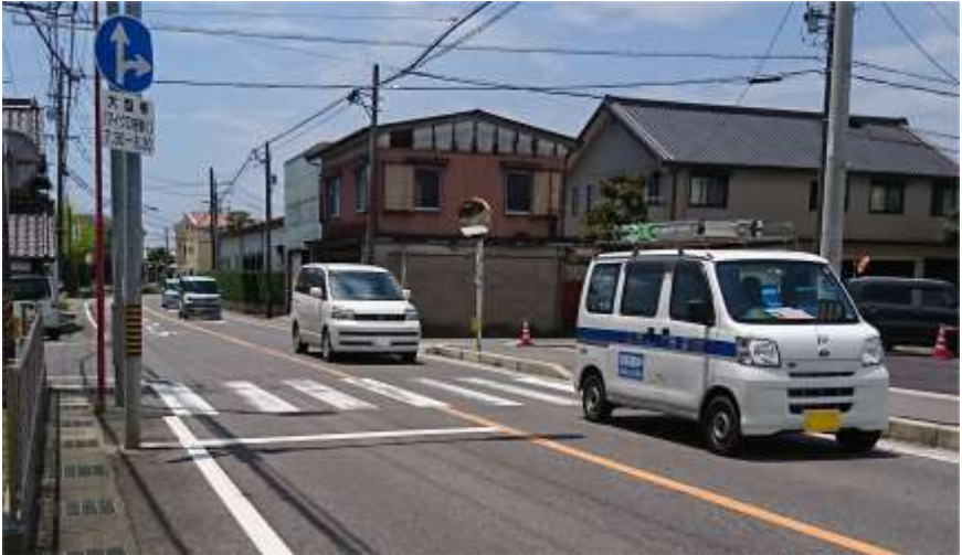
撮影場所 A →