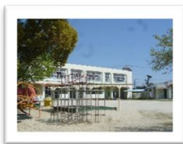
高瀬保育園(高瀬町)

こども園になると、どんな変化が生じますか。預かり時間、サービス内容、費用などは、変わりますか。保護者への入園に関する情報提供は、いつ頃、どのように行われますか。