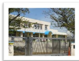
東部保育園(大岡町)