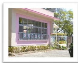
えのき保育園(榎前町)