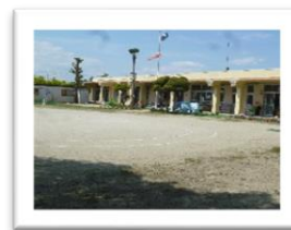
城ヶ入保育園(城ヶ入町)