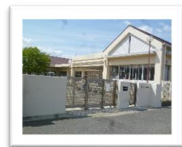
三ツ川保育園(寺領町)